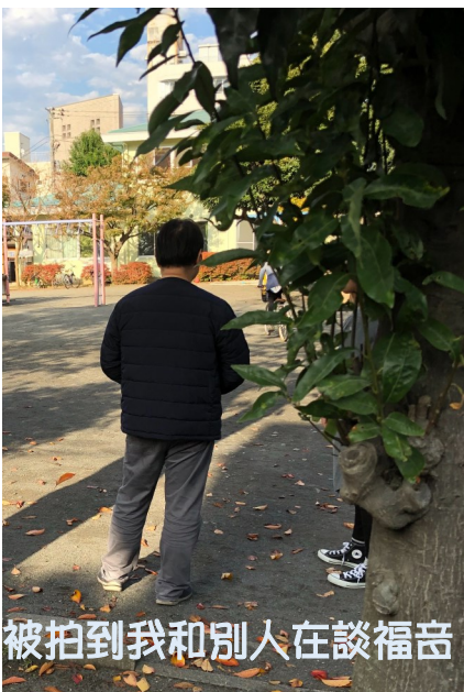
被拍到我和別人在談福音

住下去的決心會改變我們的態度來面對與學習新的環境。聖誕節就是耶穌基督為了我們成為人和神之間的橋樑，祂移民來到了人間，成為我們眾人的祝福。其實，基督徒的人生就有如移民，我們本來是跟這屬地的世界認同。但主拯救我們以後，我們已經變成了天國子民，就當以屬天的使命為人生目標。但移民的人都知道，你會想念家鄉的料理以及親朋好友。屬天與屬地的征戰就像這樣，常常在我們內心中發生中。上個月分享到在7月到9月之間，我們遇到了許多挑戰，彷彿是屬靈的冬天。時常會被屬地的想法所影響，而沒有定睛在耶穌基督身上。感謝主，雖然天氣變的很冷，但屬靈的春天似乎來臨了。主的恩典與呼召是不會落空的。曾經一度懷疑我能在日本做什麼？想到學語言的緩慢、以及面臨各項的挑戰，頓時動搖我們來日本的目的與使命。我向主求，請給我些引導與印證，讓我知道我來日本的目的到底是什麼。（雖然我們都知道要傳福音、建造門徒、建立教會，但實際上若沒有機會或能力，時常被自己的軟弱影響，認為是在浪費時間。若我們指定睛自己的能力）就在這樣的禱告中，主給了我機會，讓我跟幾位日本人談到信仰與人生。用我破破的日文，能有機會談論到這類話題，真的是神給的恩典。讓我再次瞭解到『成為橋樑就是聖誕節的精髓，也是基督徒的使命』主耶穌道成肉身也等了30年才出來傳道，我們才來一年，就想有什麼大的成就，真是需要謙卑與耐心等候。求主幫助我們，能好好學習語言、文化，相信不久的將來，主會預備更多的機會讓我們成為那『橋樑』。